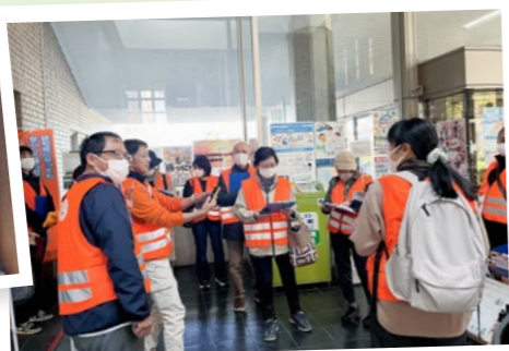
地域包括鴨江 認知症ひとり歩き 徘徊模擬訓練を実施