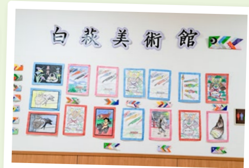
白萩美術館 デイサービス美術館、開館中