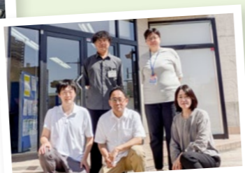
健康は足元から。 足のケアと日常でできる工夫を ご紹介しました。