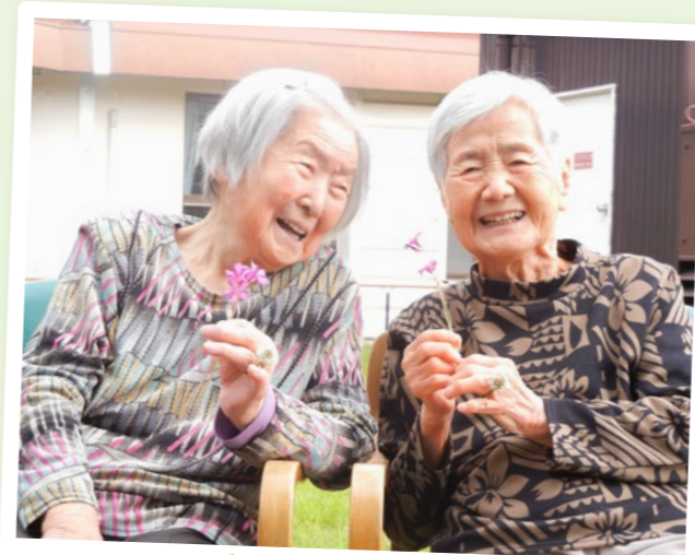
デイ第二九重荘 お花をつんでハイ、チーズ！