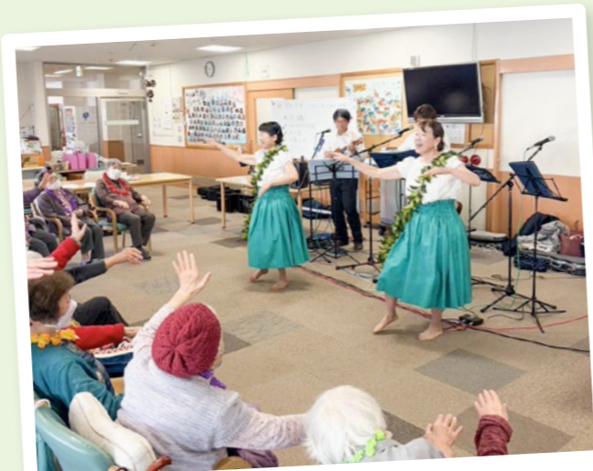
デイ半田山九重 フラダンスショーの様子