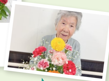
華やかに仕上がりました。