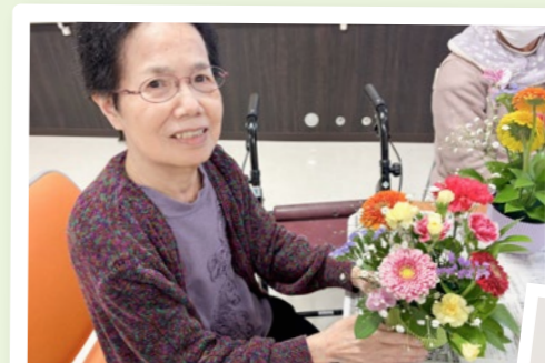
九重荘 フラワーアレンジメント