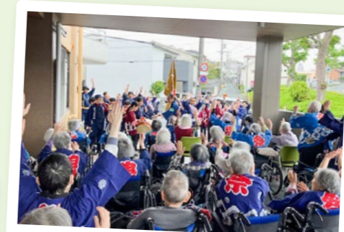
白萩荘 浜松祭り子供練り