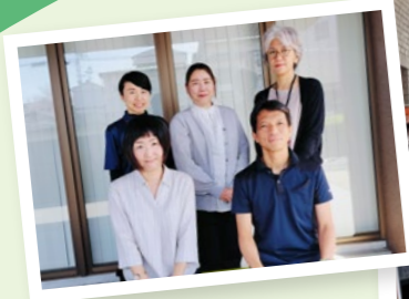
今年度の包括鴨江スタッフ一同。 地域のに寄り添う頼れるチーム！