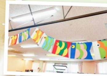
季節に合わせて 飾りつけ♪