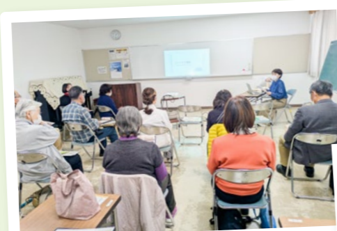
地域包括板屋 介護教室を開催！