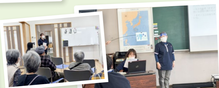
地域包括湖西白萩 認知症サポーター養成講座