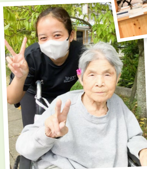
第二九重荘 お散歩に出かけました