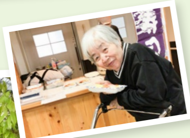
職員と 楽しく出かけ！