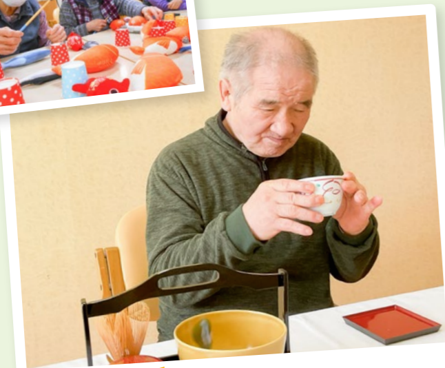
ショートステイ湖西白萩 花見茶会