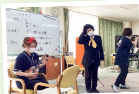
デイ湖西白萩 愉快的音楽演奏会