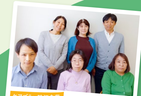
ケアプラン鴨江白萩 新しい仲間が増えました