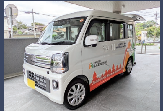
公益財団法人 鈴木道雄記念財団様 寄付車両

TEAM BLEND （フラダンス） 浜松サクソフォンクラブ 静岡県草笛協会 音のアラカルト （演奏） なごみ&しあわせ様 （ロコモ体操）